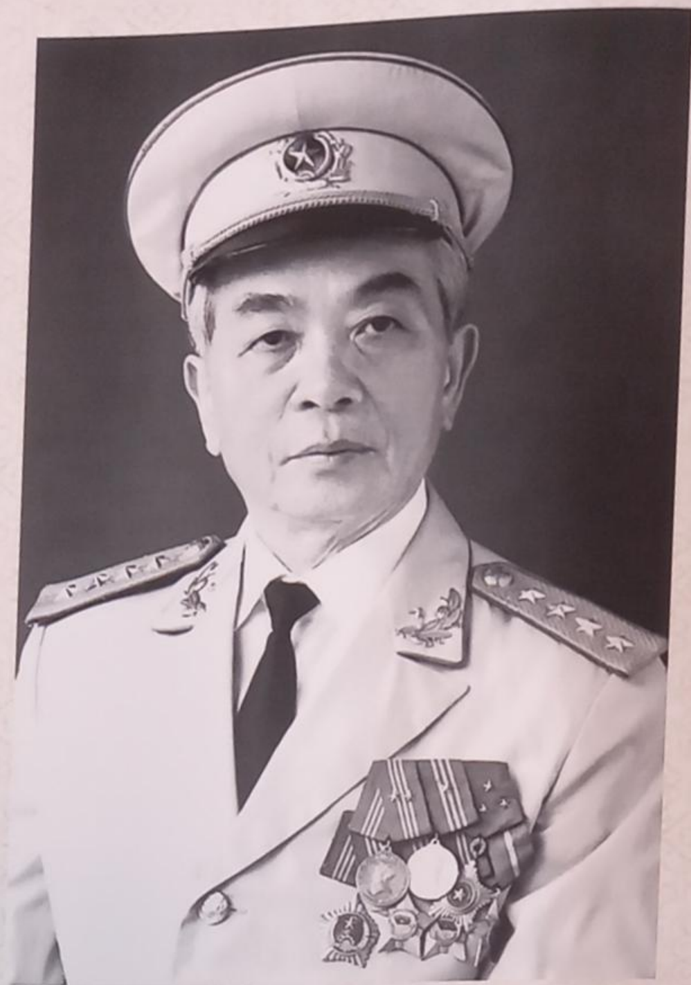
ĐẠI TƯỚNG VÕ NGUYỄN GIÁP GENERAL VÕ NGUYỄN GIÁP (1911-2013)